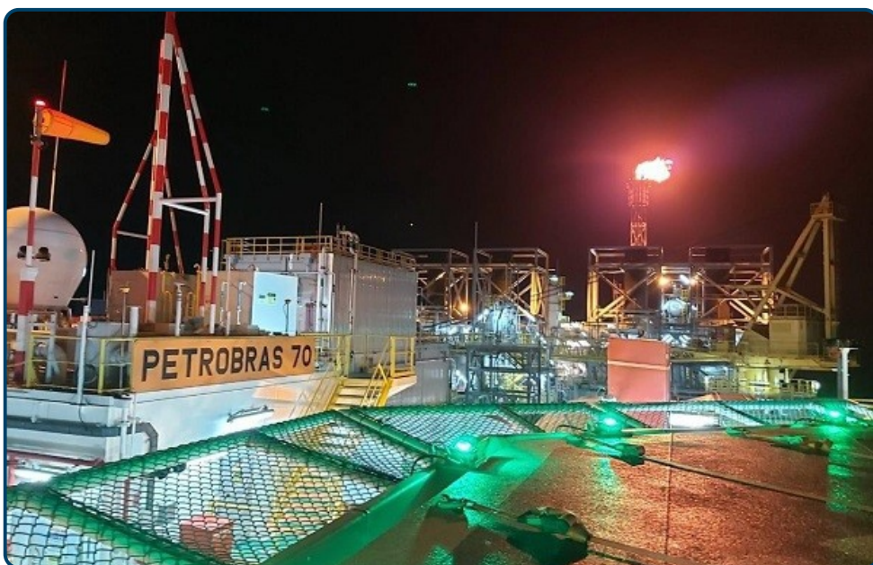
Plataforma tem capacidade para processar diariamente até 150 mil barris de óleo e tratar até 6 milhões de m 3 de gás natural

A P-70, plataforma própria, quinto FPSO (unidade flutuante de produção, armazenamento e transferência de petróleo e gás) da série dos replicantes, possui capacidade para processar diariamente até 150 mil barris de óleo e tratar até 6 milhões de m 3 de gás natural. A unidade vai operar a cerca de 200 km da costa do estado do Rio de Janeiro, em lâmina d'água de 2.300 m, com previsão de interligação de até oito poços produtores e oito poços injetores.