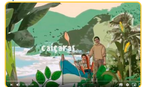
Projeto Povos - Cuidar é Resistir FCT (Relatos da Quarentena I)

Os impactos da pandemia nas comunidades participantes do Projeto Povos foram documentados na série de vídeos “Relatos da Quarentena”. Os vídeos estão disponíveis no canal do Youtube da OTSS (Observatório de Territórios Sustentáveis e Saudáveis da Bocaina).