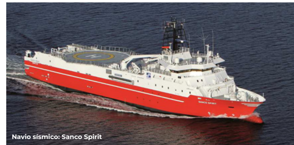
Navio sísmico: Sanco Spirit

ATIVIDADE DE PESQUISA SÍSMICA MARÍTIMA 4D NODES NO CAMPO DE TUPI-IRACEMA MONITORA, NA BACIA DE SANTOS