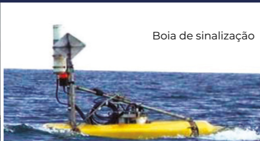
Boia de sinalização