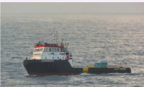
Embarcação assistente: LH Comandante

PARA EVITAR ACIDENTES, MANTENHA UMA DISTÂNCIA MÍNIMA DE 3 MILHAS NÁUTICAS DOS NAVIOS.