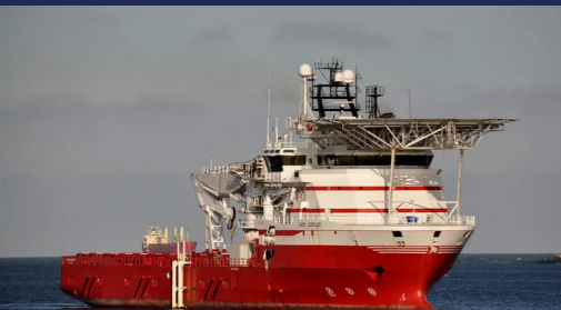
Embarcação de instalação de NODES: Siem Dorado