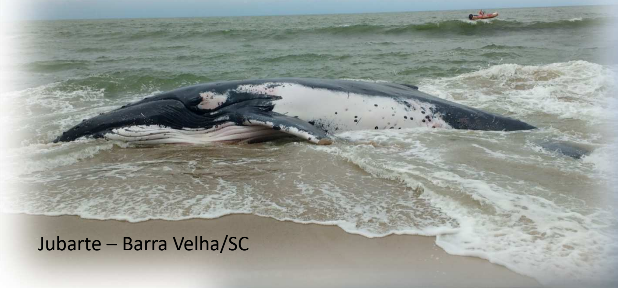
Jubarte – Barra Velha/SC