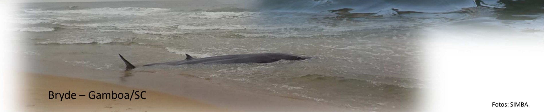
Bryde – Gamboa/SC