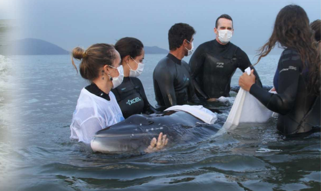
Minke – Pontal do Sul/PR