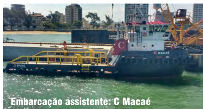
Embarcação assistente: C Macaé