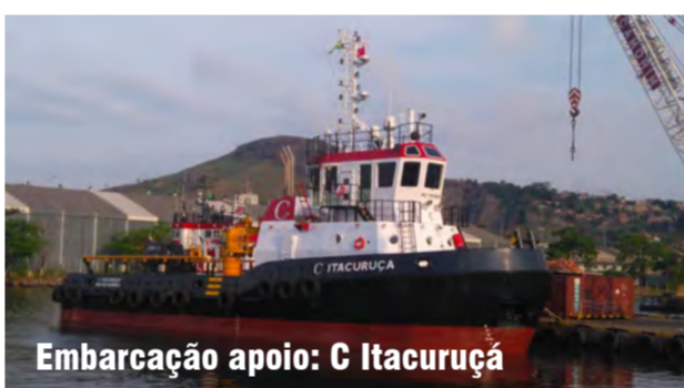
Embarcação apoio: C Itacuruçá