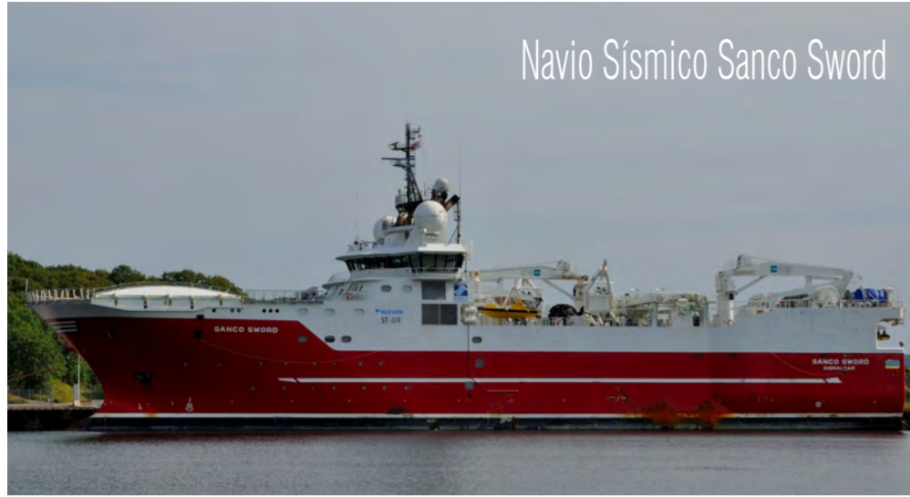
Navio Sísmico Sanko Sword