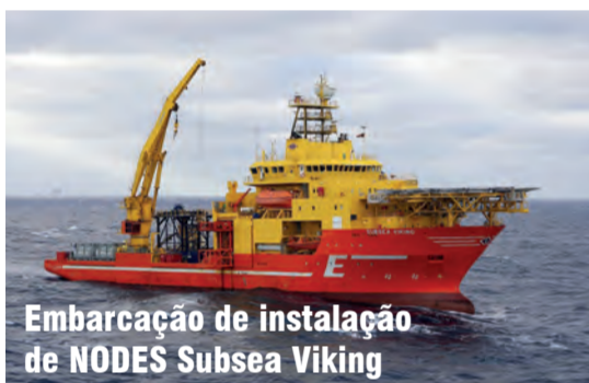
Embarcação de instalação de NODES Subsea Viking