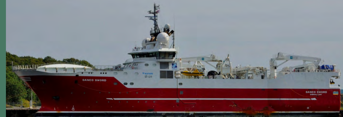
Navio Sísmico Sanco Sword