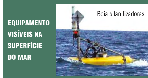
EQUIPAMENTO VISÍVEIS NA SUPERFÍCIE DO MAR