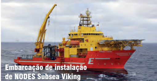
Embarcação de instalação de NODES Subsea Viking