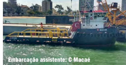
Embarcação assistente: C Macaé