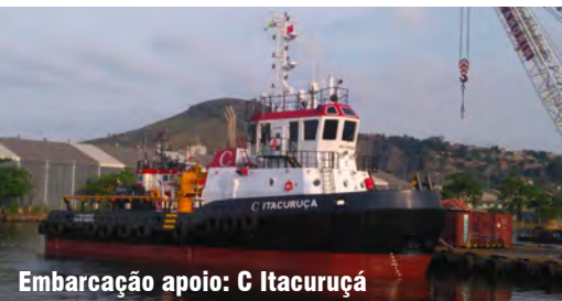
Embarcação apoio: C Itacuruçá