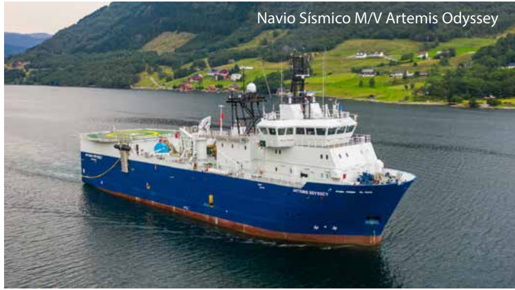
Navio Sísmico M/V Artemis Odyssey