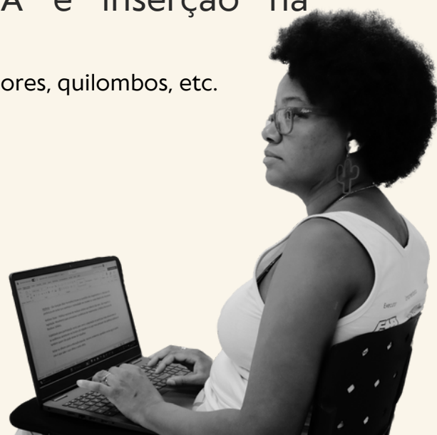
Imagem: educadora de Niterói. Autor: Adair Aguiar