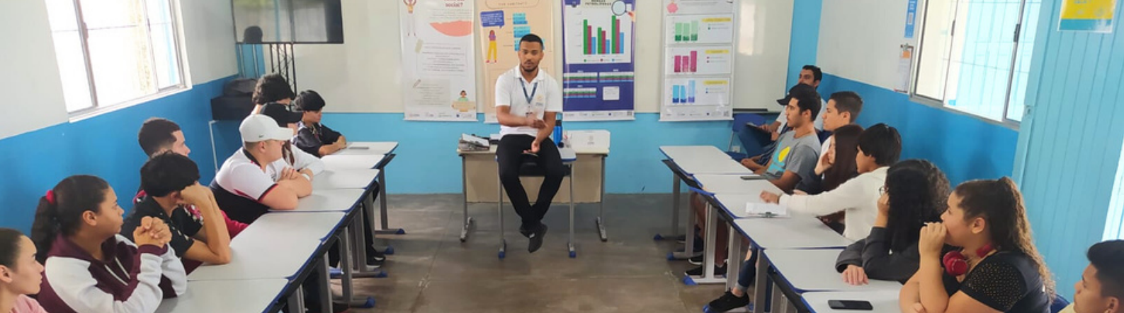
Imagem: roda de diálogo na Escola Estadual Professora Elvira Silva, em Iguape.