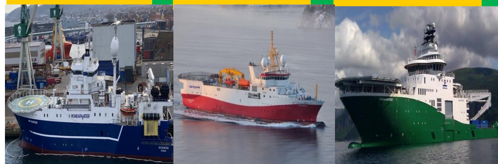
Embarcação Havilla Subsea